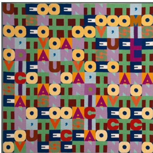
Mille novecento settantotto , Alighiero Boetti, 1978