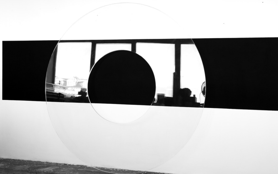
Lapsus VIII, 2010 | Círculo de metacrilato de 180 cm de diámetro x 1,5 cm | Pintura mural

Miquel Mont fue uno de los artistas que atrajo la atención de Josep Suñol a principios de los noventa, en un momento en el que la mirada del coleccionista estaba focalizada sobre todo en artistas emergentes y propuestas que se desarrollaban en paralelo a los circuitos oficiales. Su obra, que denotaba un claro interés por el trabajo analítico de la pintura, no tardó en incorporarse a la colección.