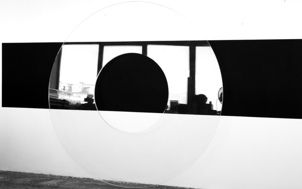
Lapsus VIII, 2010 | Cercle de metacrilat de 180 cm de diàmetre x 1,5 cm | Pintura mural

Miquel Mont va ser un dels artistes que va atraure l'atenció de Josep Suñol a principis dels noranta, en un moment en què la mirada del col·leccionista estava focalitzada, sobretot, en artistes emergents i propostes que es desenvolupaven en paral·lel als circuits oficials. La seva obra, que denotava un clar interès pel treball analític de la pintura, no va trigar a incorporar-se a la col·lecció.