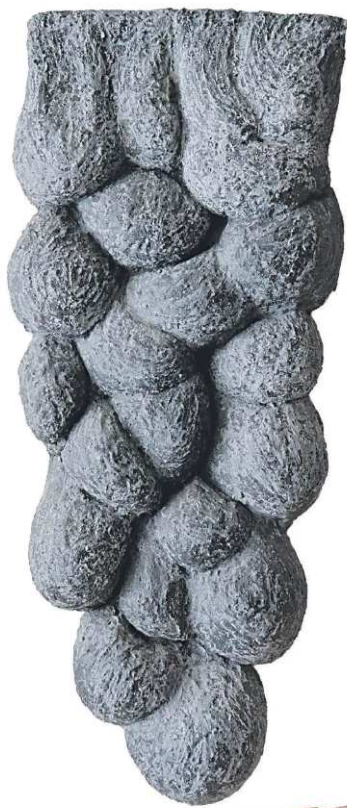
A dalt, 'Gea', 2000, ceràmica. A la dreta, 'La presonera', 1993, ceràmica