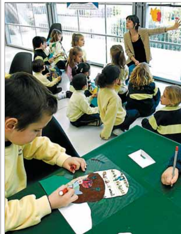
Un grup d'escolars van estrenar ahir al matí l'Espai Taller amb l'activitat 'Sóc el collage'

La Fundació Joan Miró estrena un nou espai taller al jardí dels xiprers