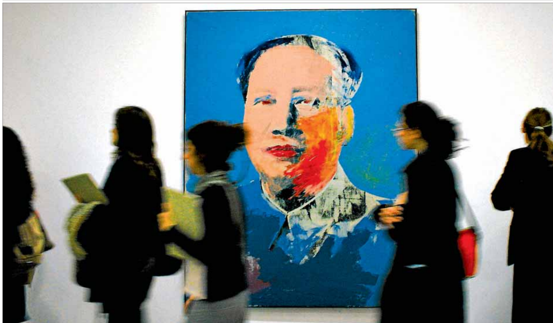
El 'Mao' d'Andy Warhol és una de les obres que presideix l'entrada a la nova Fundació Suñol, en ple centre de Barcelona