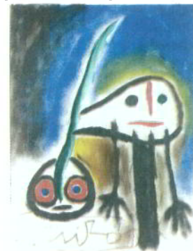
Una criatura amb cua de Joan Miró.