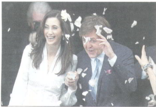
Paul McCartney i Nancy Shevell diumenge a la sortida de l'ajuntament londinenc on es van casar

Stella s'ha esmerçat especialment a donar forma a la part alta del vestit, ideada com una brusa suau i elegant, i