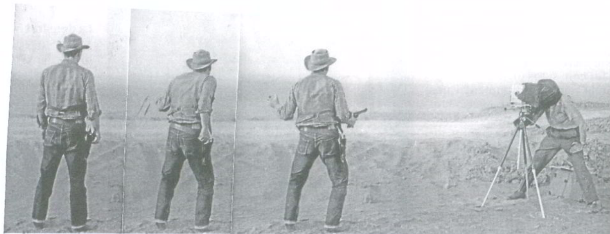
Una de les fotografies de l'arxiu de J.R. Plaza inspirada en l'univers dels westerns . LA VIRREINA

L'exposició s'obre amb Petita història de la fotografia II , una instal·lació en què es poden veure totes les dobles pàgines dels àlbums i que té un dels seus punts àlgids en una altra obra de grans dimensions: la instal·lació que conté les 900 fotografies verticals de l'arxiu de Plaza.