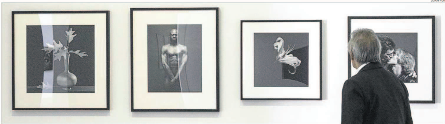
► Les quatre fotografies de Robert Mapplethorpe que reuneix l'exposició 'Perfect Lovers' a la Fundació Suñol.