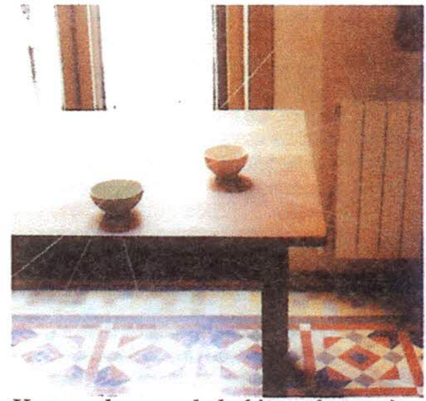
Xarxes de records habiten els espais.

Uncover vol dir 'destapar', 'descobrir'. I això és el que ha fet Nuria Canal (Burgos, 1965), revelar els fantasmes que habiten els espais, ensenyar allò que els ocupa i que no sempre veiem. Com? Doncs sense evidències, utilitzant uns fils transparents que es veuen en funció de la llum. A través de cinc fotografies, Canal ens proposa un recorregut pels seus llocs més preuats, i com és habitual en el mitjà, fixa així les restes del passat. Els fils teixeixen aquí una xarxa de records, que pot ser densa o etèria, segons com ho il·lumini la nostàlgia. Però això només és un exemple, el cas personal de l'artista, que s'afegeix a l'experiència que proposa in situ al visitant. Perquè el cub blanc del Nivell Zero també s'omple de fils transparents que l'artista ha tensat des de totes les parets fins a l'únic objecte que presideix la sala, un