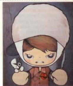
TVBoy és l'artista i el personatge.

Sortint d'un formatge emmental o d'una sopa Campbell, els personatges que protagonitzen els grafitos de TVBoy es troben a mig camí entre la innocència del dibuix animat i la violència del món contemporani. O potser són les dues coses alhora, i el que vol aquest artista amb els seus nens de cap gros és convertir el món contemporani en la frívola mirada de Tom i Jerry. Empunyant un osset de peluix de la mateixa manera que un ganivet afilat, un d'ells apunta l'espectador amb una pistola, fent-nos veure la mítica sopa de tomàquet com un gran bassal de sang. Ara bé, la referència a la llauna de Campbell té altres connotacions: Warhol, evidentment, i amb ell, la crítica a una societat dirigida per les grans multinacionals, en què mana el consumisme i el lliure mercat. Perquè la superficialitat del pop-art és, a