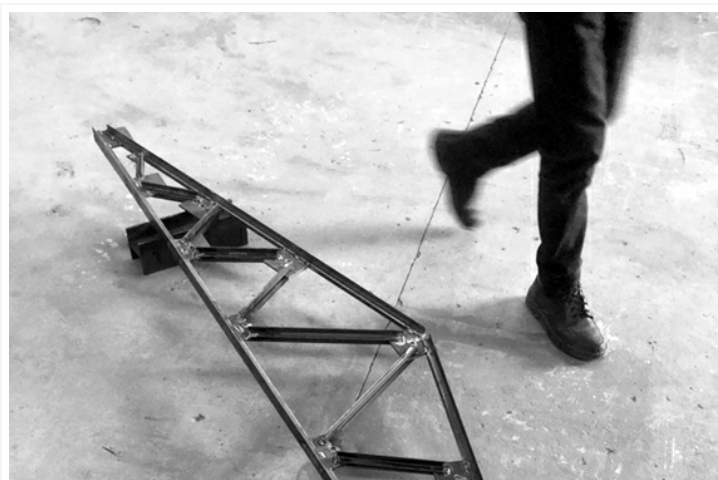
— "Models d'estructura", una de les obres de l'exposició de Jordi Mitjà a la Fundació Suñol | Foto: Jordi Mitjà

El pare de Jordi Mitjà era serraller, però la seva obra no és un homenatge. O no és només un homenatge. La Fundació Suñol acull fins al dia 11 de març l'exposició L'escultura no és important , on l'artista figuerenc repensa l'estètica de tots els materials típics d'aquesta professió.