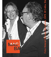
Dins: Revistes per a donar (i donar) antinòmics

POESIA BROSSA Exposició 21 de setembre de 2017 — 25 de febrer de 2018