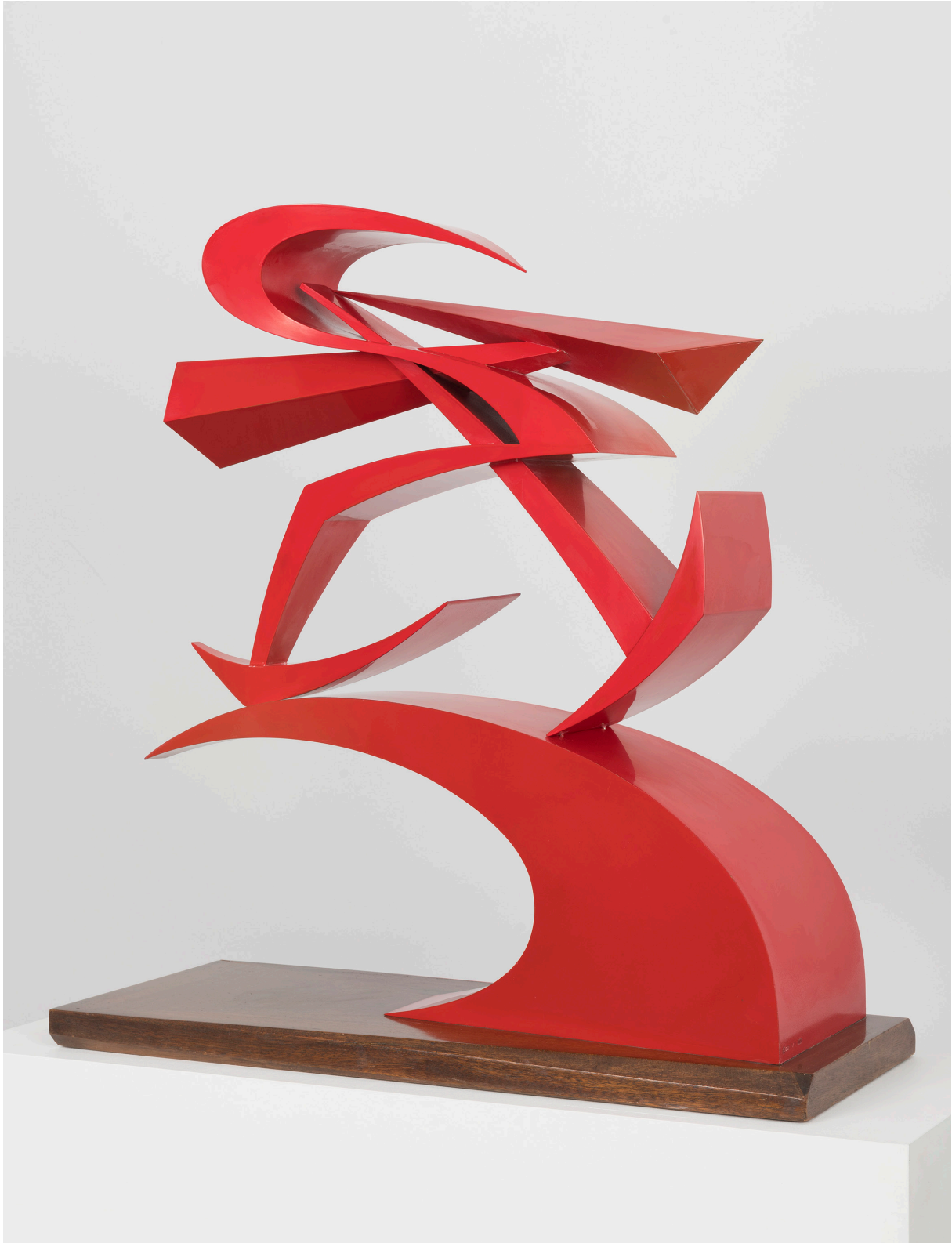
GIACOMO BALLA | Linee-Forza del pugno di Boccioni II | 1968 (dal prototipo originale del 1915)

Il movimento era uno dei soggetti preferiti dagli artisti futuristi che cercavano di catturarlo senza una camera fotografica o videocamera, usando solo la pittura o la scultura. Ma se la pittura crea immagini fisse e la scultura produce oggetti immobili... come possono rappresentare le azioni?