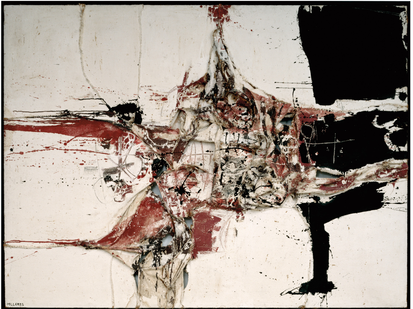
MANUEL MILLARES | Pintura nº5 | 1959

En las obras informalistas la materia, los trazos, los colores y las formas son manifestación explícita de la energía y la intención del artista, al tiempo que nos hablan del contexto en que fueron creadas. Para cerrar el círculo comunicativo del arte, las obras necesitan nutrirse de nuestra reacción en forma de sentimientos y emociones. Así pues, ¿qué nos hace sentir la obra? ¿Cómo trasladar los diferentes sentimientos a soluciones plásticas?