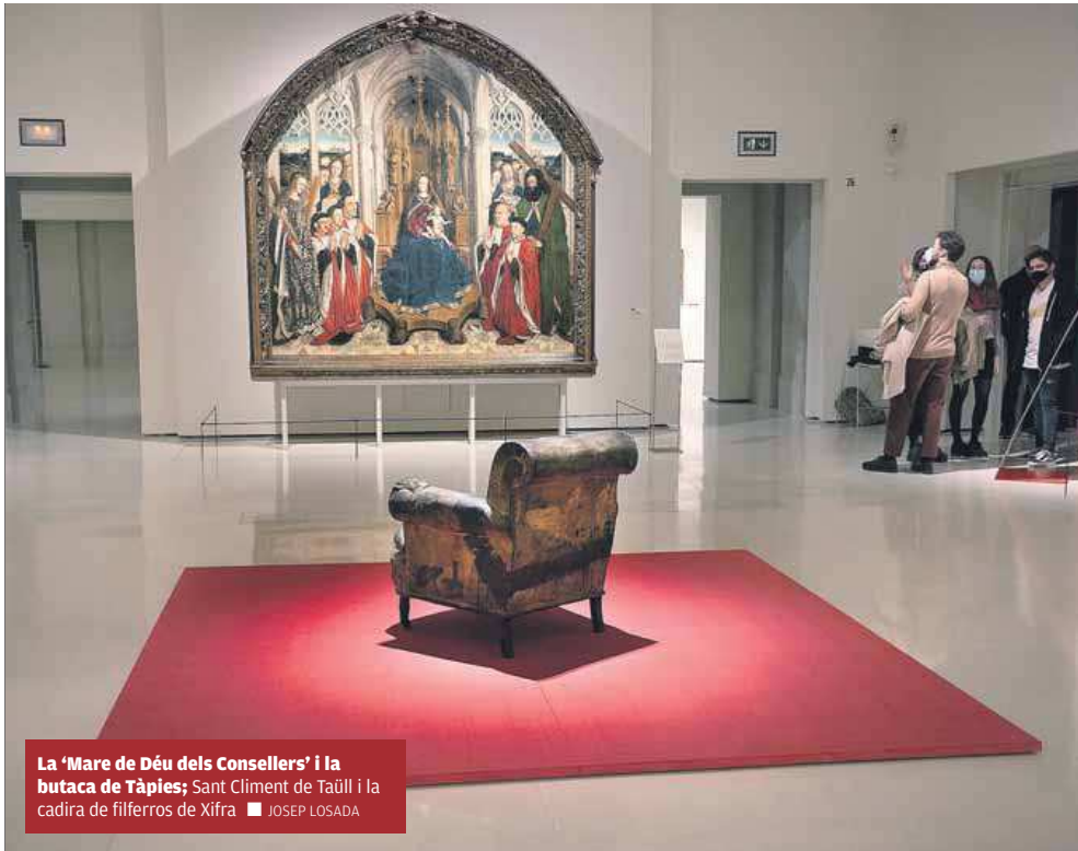
La 'Mare de Déu dels Consellers' i la butaca de Tàpies; Sant Climent de Taüll i la cadira de filferros de Xifra ■ JOSEP LOSADA