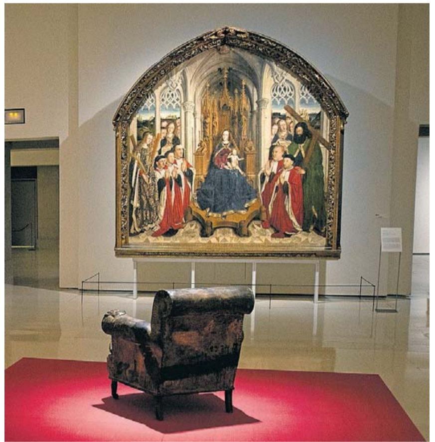
01. Chaise de salon d'art, de Xifra, i el pantocràtor de Taüll. 02. Butaca, de Tàpies, i La Mare de Déu dels Consellers.