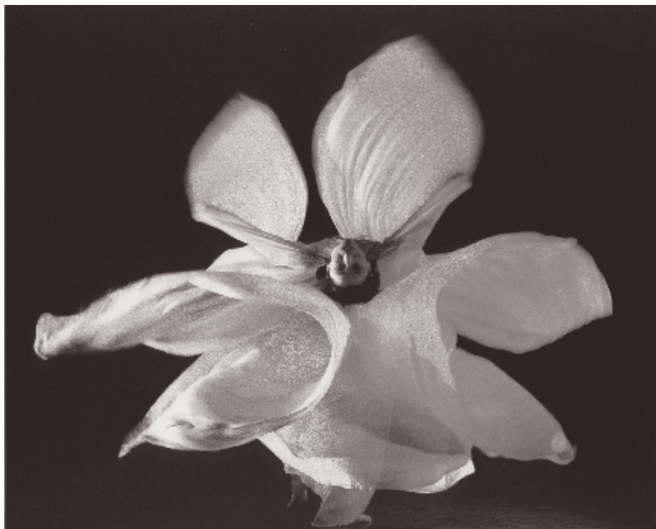
Loïe Fuller (1862-1928) Coreografía de Danza de la serpiente / Danse Serpentine, 1896